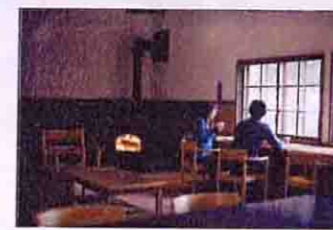
▲昨年にオープンしたカフェからも雪景色を一望。薪ストーブが暖かい

☎0126-63-3137 園美唄市落合町栄町 JR美唄駅からバス20分 園札幌中心部から道央道美唄IC下車1時間 園9時~17時 園火曜、祝日の翌日(日曜は除く) 園入館無料 ※http://www.kan-yasuda.co.jp/arte.html ※カフェアルテ ☎0126-63-1010 園10時~17時