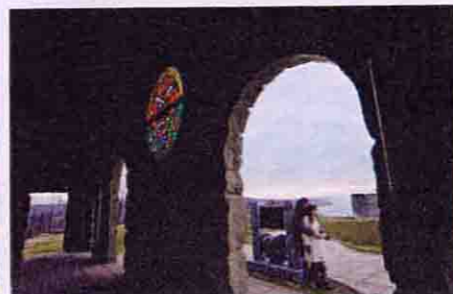
▲プロポーズにふさわしい場所としてカップルに人気の場所