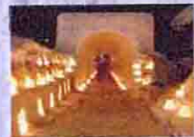
▲雪景色を彩るキャンドルの温かな炎。ふたりで過ごす冬の夜は忘れられない記念日に

小樽の冬の風物詩としてカップルにも人気のイベント。400個のキャンドルが浮かぶ運河や優しい炎が揺れる手宮線会場のスノーチューンなど、街全体がロマンチックムード一色になる。