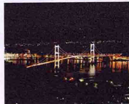
▲地元の若者の間でウワサに火が付き実際に結婚したカップルも多いとか

園室蘭市役所経済部・観光課 ☎0143-25-3320 園室蘭市陣屋町~祝津町 園JR室蘭駅からバス10分 園札幌中心部から道央道室蘭IC下車1時間30分