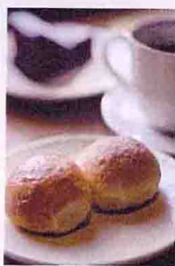
▲美唄産小麦「春よ恋」のポコボコばん70円〜。ケーキもパンも手作り

飛行機の窓の外に、どこまでも広がる真っ白な大地。太陽の光を反射して雪の粒がキラキラ輝き、息を吸い込むと澄みきった空気が心地いい。冬の街は車の音も降る雪にかき消され、夏とは違いとても静か。誰も歩いていないまっさらな雪原に点々と続くふたりだけの足跡は、いつまでも忘れられ