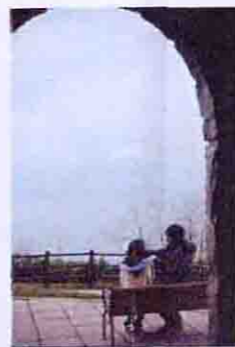
▲二人掛けのベンチからは目の前の日本海に沈む夕陽も望

啓社団法人石狩観光協会 ☎0133-62-4611 石狩市厚田区厚田 園札幌中心部からR231経由1時間10分 入場無料 ※ラヴァースプレート(1枚1000円)は市内コンビニ等で購入可