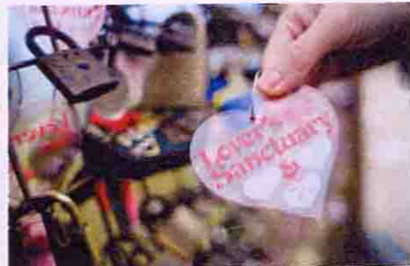
▲フェンスには訪れたカップルの南京錠やハート型のプレートがいっぱい