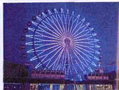
▲☆型やハート型など季節により変わる観覧車のライトアップも楽しみ

☎011-261-8875 園札幌市中央区南3条西5丁目1-1ノルベサ屋上 園JR札幌駅から徒歩15分、地下鉄南北線すすきの駅から徒歩2分 園平日11時~23時(受付終了22時50分)、全曜・土曜・祝前日~翌3時(受付終了翌2時50分) 園無休 園1ゴンドラ1名600円 ※http://www.norbesa.jp/