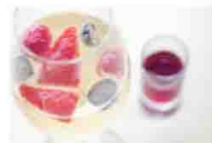
「Kiss Me」ベリーベースのカクテル (マドラウンジ)

特典 チョコレートカフェでご注文されたお客様にはアーモンドプードル、ディアカカオをプレゼント!