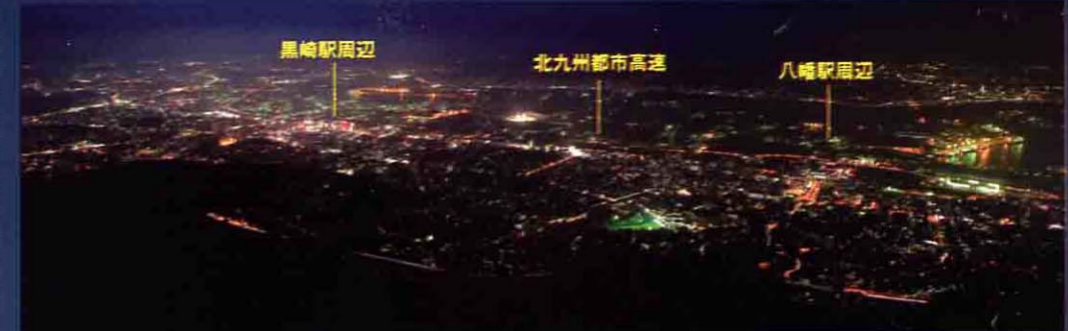
標高622mの山頂から洞海湾沿いのイルミをワイドに望む。スペースワールドの光や寄港する船の灯りも美しい