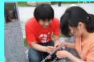
ペインティングの後は、カギを吊るすチェーンへ取り付け

カギは足掛け3年は吊るしておきます。その後、 山頂の伊吹山寺に奉納し最後は仏像になり奉ら れます。 ワイヤーに取り付け年度を表示して区別