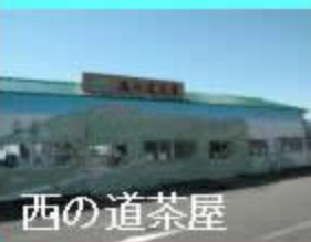
カギは大: ¥500 中: ¥300 ナンバー式: ¥500