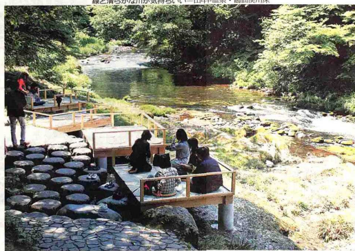
緑と清らかな川の景持ちこしし山中温泉・鶴仙渓川床

山中、山代、片山津、粟津と、光内所をたどる温泉めぐり。歴史ある各温泉がまとまった「加賀四湯博覧会」として、バスに乗り継ぎ、山中温泉へ向かう。山中温泉は泉質独特の「ナトリウム・カルシウム」を特徴とする。山中温泉は泉質独特の「ナトリウム・カルシウム」を特徴とする。山中温泉は泉質独特の「ナトリウム・カルシウム」を特徴とする。