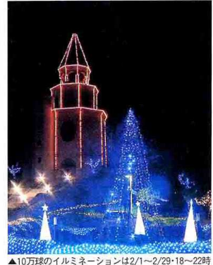
▲10万球のイルミネーションは2/1~2/29・18~22時

「愛」をテーマに作られたリゾートホテル。周囲の美しい風景は、自然豊かな丘陵に広がる。徒歩5分のバレンタインパークは昨年10月、恋人の聖地に認定され「愛の泉」や、幸せな恋人達の姿を描いた絵画が展示される。「美作市立作東美術館」がある。2月はイベントも盛りだくさん。今年のバレンタインデーはこの 恋人達のための場所、大切な人との愛を深めてみてはいかがでしょう。 ★スペシャルフルコースランチ「ル・クプル」1名2625円(通常4200円) 11時半〜14時に応急★クワイヤチャイム(ハンズベル)コンサート 「夢」2月10日限り1名500円・17時半開場一般の方も気軽に。