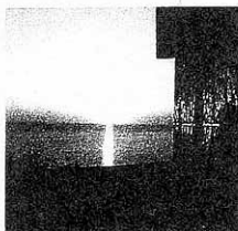
①スキー場下の駐車場から展望台までは約10分の上り。展望台からの眺めは壮観の一語

厚田公園内のスキー場頂上にある見晴らしのいい展望台。ことしの夏「恋人の聖地プロジェクト」によって、北海道で最初の「聖地」として認定された新しいデートスポット。特に海に夕日が沈む時間帯の景観がすばらしい。