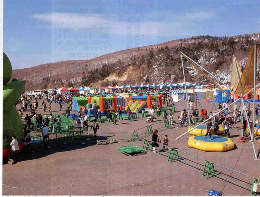
▲キロロの魅力がたっぷり詰まった「キロロまつり」は「遊ぶ・見る・食べる」を体験できる。宿泊日帰りもとことんキロロを遊びつくそう

☎0120-489-966 ☎0135-34-7100(キロロリゾート 予約センター)赤井川村常盤 128の1札幌道札幌西IC50分可 可「ホテルピアノ」全282室、「マ ウンテンホテル」全140室15/ 11泊2,000台(無料)●札幌・小樽 より直通路線バス(要問合せ)● 「リゾートプラン」(POWコード: RPA)、「GWリゾートプラン」 (POWコード:GWP)、「GWファミ リプラン」(POWコード:FMM)、「 ピアノファミリープラン」 (POWコード:FMP)はHPでも 予約可、POWコードを入力