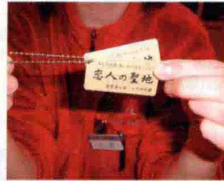
▲記念に恋人の聖地記念タグ付「恋人証明書」1枚800円も発行