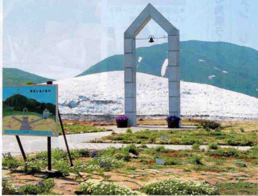
▲カップルなら一度は訪れたい恋人の聖地「ニイサの鐘」。聖地までのゴンドラはGWまで運行予定、7月までは一時休止するので早めに出掛けるのがおすすめ

「春のキロロまつり」今年も開催! 5/3~6の4日間、マウンテンセンター前駐車場にて毎年好評の「春のキロロまつり」が開催されるよ(10:00~16:00)! 食べ物屋台やヒーローショー、ゲームコーナー、全10基のふわふわパークなど家族に嬉しいイベントが盛りだくさん。ファミリーランチバイキング・温泉入浴・プール利用がセットになったお得な日帰りプラン(大人2,000円、小学生1,400円、幼児700円)もあるので気軽にチェックしてみよう。 ▶様々なイベントが開催される4日間、GWの家族旅行はキロロに決まり