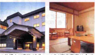
▲札幌より車約40分、日本海は徒歩約5分の距離。地上4F建ての番屋を意識した設計

☎0133-62-5000 石狩市弁天町34 圏札幌よりR231経由40分 可全24室(圏20室2バリアフリー1圏1) 圏15/10 圏150台(無料) ●施設「鯨の湯」個室(有料)圏第4 圏(圏の場合は翌日、7月のみ第3 圏)、リクライニングコーナー、「味処いしかり」、「浜梨かふえ」(レストラン 圏11:30~20:30 ※ 圏20:00) ●日帰り入浴/大人600円、4~12歳300円(4~10月は11:00~21:00、11~3月は11:00~20:00)