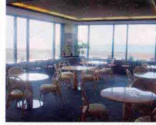
▲小腹が空いたら、地産地消を目指す「鯨の湯」2F「浜梨かふえ」へ