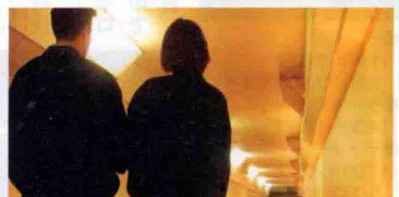
▲「鯨の湯」と「番屋の宿」は間接照明が施された地下通路で繋がっているため客室の浴衣着のまま移動できる