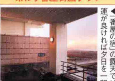
◀「番屋の宿」の露天では運が良ければ夕日を一望

11,000円 (1室2名) 1名2食 ◎土祝前日は1,000円増 部屋 和室利用 食事 夕食は宴会場にて「番屋御膳」、朝食は宴会場にて和定食 ※夕食部屋食1,500円増 ※子供料金は要問合せ