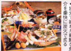
◀地元で捕れた新鮮な魚介を豪快に炭火で炙る

15,000円 (1室2名) 1名2食 ◎土祝前日は1,000円増 部屋 和室利用 食事 夕食は炭焼専用会場にて地場産食材を使用した炭焼、朝食は宴会場にて和定食 ※1日1組限定 ※子供料金は要問合せ