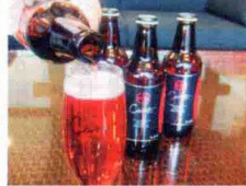
▲シソの葉で染めたピンク色の、石狩の地ビール「カナストリー」

☎0133-62-5000 石狩市弁天町34 圏札幌よりR231経由40分 可全24室(圏20室2バリアフリー1圏1) 圏15/10 圏150台(無料) ●施設「鯨の湯」個室(有料)圏第4 圏(圏の場合は翌日、7月のみ第3 圏)、リクライニングコーナー、「味処いしかり」、「浜梨かふえ」(レストラン 圏11:30~20:30 ※ 圏20:00) ●日帰り入浴/大人600円、4~12歳300円(4~10月は11:00~21:00、11~3月は11:00~20:00)