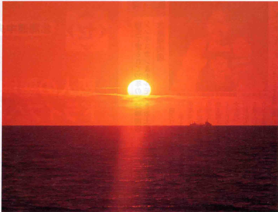
▲春から初夏にかけて美しさを増す夕暮れ時の景観。この季節の日の入りは18時30分頃。日本海に沈む感動的な夕日を目に焼きつけて

1,280円 1名2食 日帰り入浴+食事 ※日帰り入浴+食事(お蕎麦と寿司のセット) ※1,480円・1,880円も有(要問合せ) ※受付は19:00入館まで