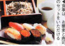
◀食事は、お蕎麦と寿司のセットをいただける

1,280円 1名2食 日帰り入浴+食事 ※日帰り入浴+食事(お蕎麦と寿司のセット) ※1,480円・1,880円も有(要問合せ) ※受付は19:00入館まで