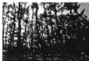
浜坂県民サンビーチ松の森