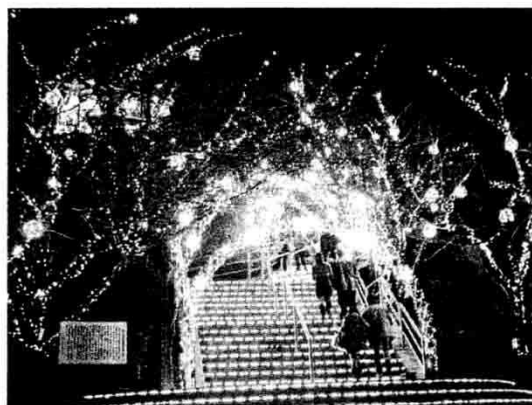
続々 カップルが大勢訪れた牛岐城跡公園。聖地として恋人を見守り続ける